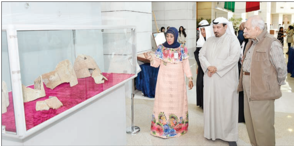
جولة في المعرض