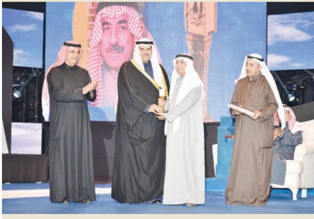
الفنان محمود الرضوان في مجال الفنون التشكيلية