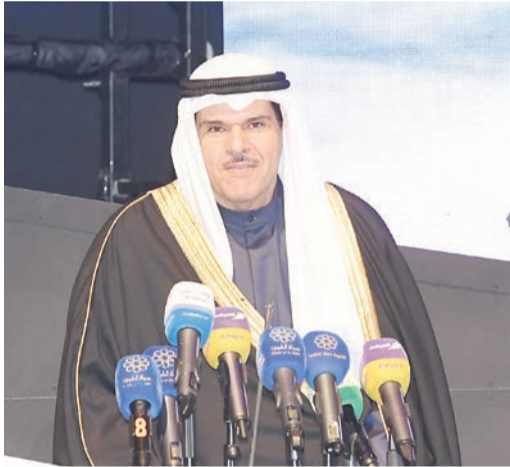
وزير الاعلام الشيخ سلمان الحمد الصباح

بأبنائها الحائزين جوائز الدولة التقديرية والتشجيعية كانت لوحة تعبيرية تجسد وقوف أبناء الوطن الواحد خلف رايته، يتبادلونها منفردين وملتحمين في مواجهة الأخطار والصعاب، ليسلموا الراية إلى جيل جديد.