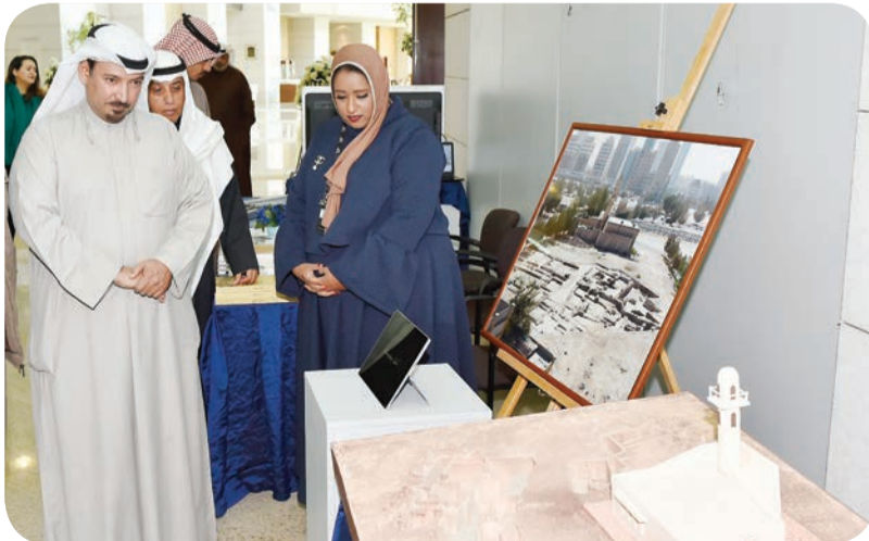
■ افتتاح معرض القطع الأثرية المرممة من موقعي تل بهيئة والصبية ص 14

تأتي أهمية جائزة الدولة التقديرية والتشجيعية في إطار مستقبلي متناغم مع الحاضر، وذلك على سبيل بناء صرح ثقافي كويتي دعائمه هؤلاء الذين يبذلون قصارى جهدهم في سبيل إعلاء كلمة الثقافة عالية، ومن ثم الوصول مستقبلاً إلى مستوى حضاري ونهضوي تفتخر به الكويت. ومنذ سنوات طويلة يتم تكريم الثقافة والإبداع والريادة، مما أوجد حصيلة مهمة من الأسماء التي تفتخر بها الكويت، حاضراً ومستقبلاً. وتقول الأمانة العامة للمجلس الوطني للثقافة والفنون والآداب في الكتيب الذي تم توزيعه على الحضور في افتتاح مهرجان القرنين الـ 23: «دأب المجلس الوطني للثقافة والفنون والآداب، بوصفه راعياً أساسياً للعمل الثقافي في الكويت، على تكريم المميزين من أبناء الوطن، لأن التكريم يمثل أحد أوجه رعاية وتشجيع الحركة الفكرية والثقافية، فهو ليس فقط شكلاً من أشكال الوفاء والتقدير للمتميز ممن يضيفون جديداً إلى روافد هذه الحركة، بل يعد كذلك ركناً أساسياً لتحفيز الأجيال الصاعدة على الانخراط بحماس في عملية التنمية بأبعادها المختلفة». والحائزون على جوائز الدولة التشجيعية رواد في مجالاتهم، ولهم بصماتهم الواضحة في تاريخ الإبداع الكويتي والعربي.