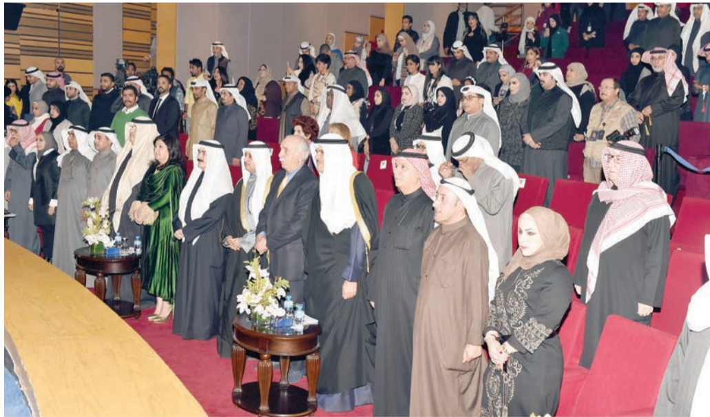
حضور حفل الافتتاح اثناء عزف السلام الوطني

كتب: مهاب نصر «إن دعم المثقفين والمبدعين بمنزلة بناء سور من نوع جديد يحمي الوطن من شرور التعصب والانغلاق، ويرسخ قيم التسامح والمحبة والانفتاح على الآخر والتعايش مع الثقافات المغايرة». بهذه الكلمات حيا وزير الإعلام، وزير الدولة لشؤون الشباب رئيس المجلس الوطني للثقافة والفنون والآداب الشيخ سلمان الحمد مبدعي الكويت وباحتياها ومفكرها في ثانية ليالي العرس السنوي الذي يمثله مهرجان القرين الثقافي والذي افتتح برعاية كريمة من سمو رئيس مجلس الوزراء الشيخ جابر المبارك الحمد الصباح. وفي مستهل ليلة احتفاء الكويت