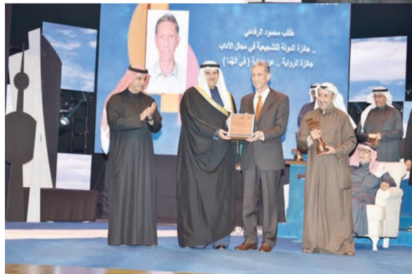
طالب الرفاعي في مجال الآداب