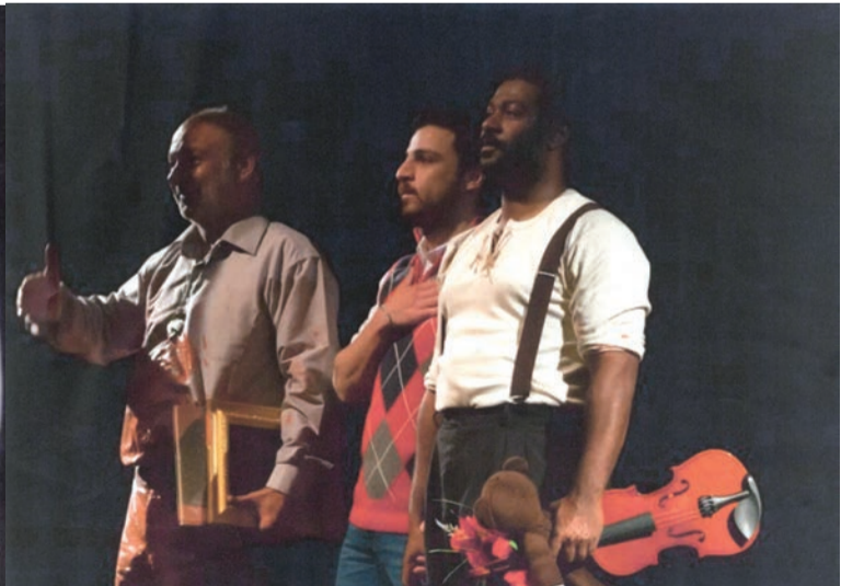
من عرض مسرحية «القلعة» لفرقة المسرح الكويتي بالجزائر