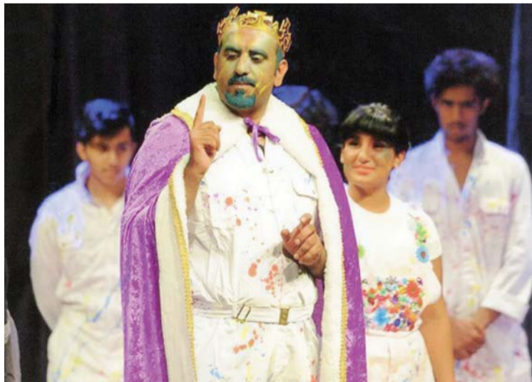
من مسرحية «مدينة الألوان» لفرقة مسرح الخليج العربي - تونس

مدينة الألوان.. في مهرجان الطفل الدولي بتونس